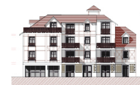
Bâtiment C - FAÇADE OUEST