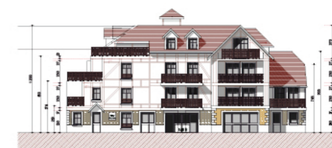
Bâtiment B - FAÇADE EST